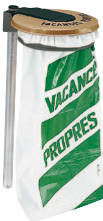
Spécial montagne ou campagne